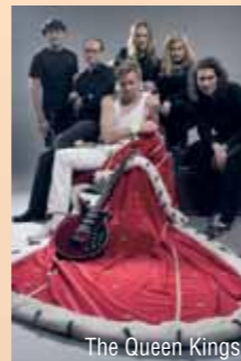
The Queen Kings