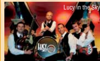
Lucy in the Sky